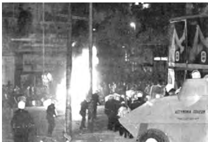
Η αστυνομία πόλεων με τεθωρακισμένα επιτίθεται σε διαδηλωτές - Πολυτεχνείο 1980