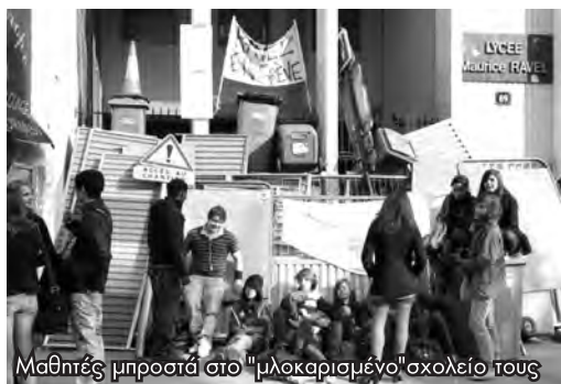
Μαθητές μπροστά στο "μλοκαρισμένο" σχολείο τους

Το απεργιακό κίνημα είχε ως κοινή τακτική τον αποκλεισμό ή κατάληψη των χώρων εργασίας και το μπλοκάρισμα των δρόμων. Αποκλεισμοί σταθμών από τους σιδηροδρομικούς, σχολείων και σχολών από μαθητές και φοιτητές, μεγάλων εργοστασίων όπως της Renault και της Peugeot, διυλιστηρίων και αποθήκες καυσίμων, με αποτέλεσμα να σταματήσουν να κινούνται για μέρες τα φορτηγά και λεωφορεία, είχαν ως στόχο την παράλυση της οικονομίας. Παράλληλα ξεσπούν εκτεταμένες συγκρούσεις με τους μπάτσους σε πολλές πόλεις. Επιθέσεις γίνονται σε μεγάλα εμπορικά κέντρα και πολυκαταστήματα, σε σουπερμάρκετ, σε γραφεία ευρέσεως εργασίας, σε τράπεζες, σε αστυνομικά τμήματα, στα γραφεία της MEDE (το επιφανές "συνδικάτο" των αφεντικών). Επίσης, γίνεται απόπειρα κατάληψης της όπερας στη Βασίλλη και συμβολική κατάληψη των γραφείων της Malakoff Mederic, εταιρίας