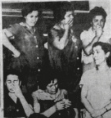
"Ετσι άκουσε, άκουσε γύρω από τις κερπίτσες επί θύρας στο παλιόν στεγάσιον. Όσοι κινείσθαι, οι συνθήσεις της τής άδραστης επί της άρας"