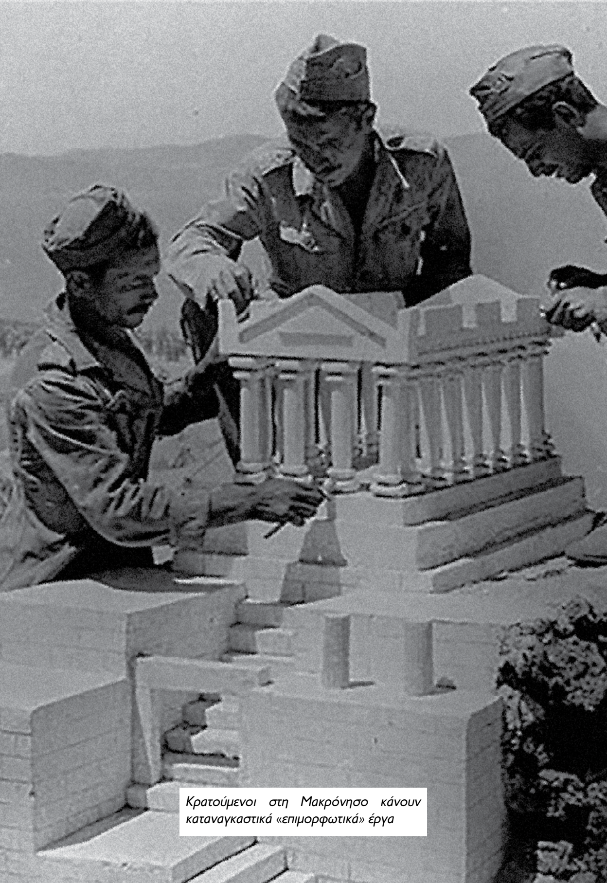
Κρατούμενοι στη Μακρόνησο κάνουν καταναγκαστικά «επιμορφωτικά» έργα