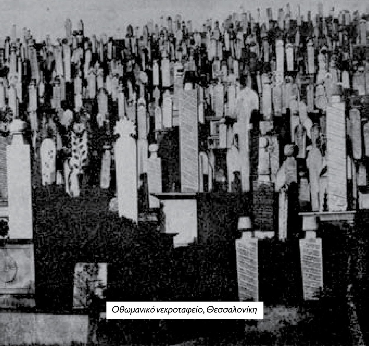
Οθωμανικό νεκροταφείο, Θεσσαλονίκη