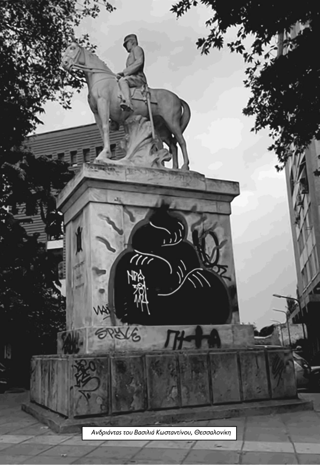
Ανδριάντας του Βασιλιά Κωνσταντίνου, Θεσσαλονίκη