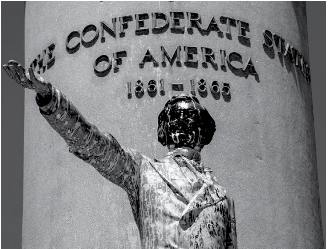
Βανδαλισμένο άγαλμα του Jefferson, Richmond, Virginia

λόμβος, στρατηγούς της Συνομοσπονδίας, τον Τζέφερσον και άλλους, οι οποίοι αποτελούν προσωποποιημένα σύμβολα της καταπίεσης των αφροαμερικάνων και όχι μόνο στην Αμερική. Ενδιαφέρον αποτελεί ότι ύστερα από την εξέγερση, δημοτικές αρχές σε διάφορες πολιτείες αποφασίζουν την πλήρη αφαίρεση ή τη μη επανατοποθέτηση των αγαλμάτων αυτών στον δημόσιο χώρο, σε μία προσπάθεια πιθανής ενσωμάτωσης κομματιού των αιτημάτων της εξέγερσης, κυρίως σε συμβολικό επίπεδο.