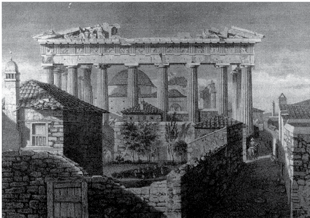
Γκραβούρα της Ακρόπολης από τον 18 ο αιώνα

αλλά και την προσμονή του μέλλοντος μέσω σχημάτων όπως η Αποκάλυψη, η δευτέρα παρουσία κ.ο.κ. Επομένως, μέχρι τον 17 ο αιώνα στον Δυτικό κόσμο, η ιστορική αντίληψη διαμορφωνόταν μέσα από τα θρησκευτικά κείμενα και την έννοια της Αποκάλυψης. Σταδιακά από τον 17 ο αιώνα και έπειτα, ανασυγκροτείται η ιστορική συνείδηση στο σύνολό της, λόγω των τεράστιων κοινωνικών και πολιτικών σχηματισμών. Το πέρασμα στη νεωτερικότητα και τον καπιταλιστικό τρόπο παραγωγής, καθιστούν ανεπαρκές το προηγούμενο ερμηνευτικό σχήμα του παρελθόντος μέσω της αποκαλυπτικής προσμονής του μέλλοντος 1 . Από εδώ και πέρα κυριαρχεί η έννοια της προόδου, η αντίληψη δηλαδή, ότι ο κόσμος πρέπει διαρκώς να προχωράει μπροστά. Η αμέσως προηγούμενη περίοδος βαφτίζεται σκοτεινή και πρέπει να αφηθεί πίσω. Αντίθετα ο Διαφωτισμός επιδιώκει τη ρήξη με τον σκοτεινό μεσαίωνα και το άνοιγμα συνδέσεων με το αρχαίο παρελθόν. Υιοθετείται επομένως το σχήμα αρχαιότητα – μέσοι χρόνοι – νεότερη εποχή. Αυτήν την περιοδολόγηση χρησιμοποιούν και τα έθνη – κράτη κατά τη δημιουργία τους, αναζητώντας στο παρελθόν τις ιστορικές συνδέσεις που θα επιτρέψουν την εδαφικοποίηση και νομιμοποίησή τους στο παρόν.