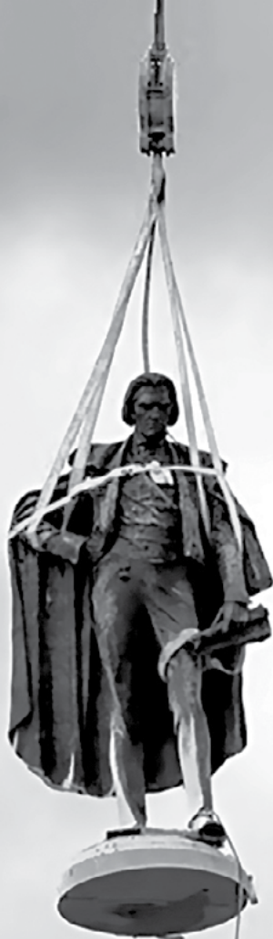
John C. Calhoun, πρώην αντιπρόεδρος των ΗΠΑ και υποστηριστής της δουλείας, South Carolina