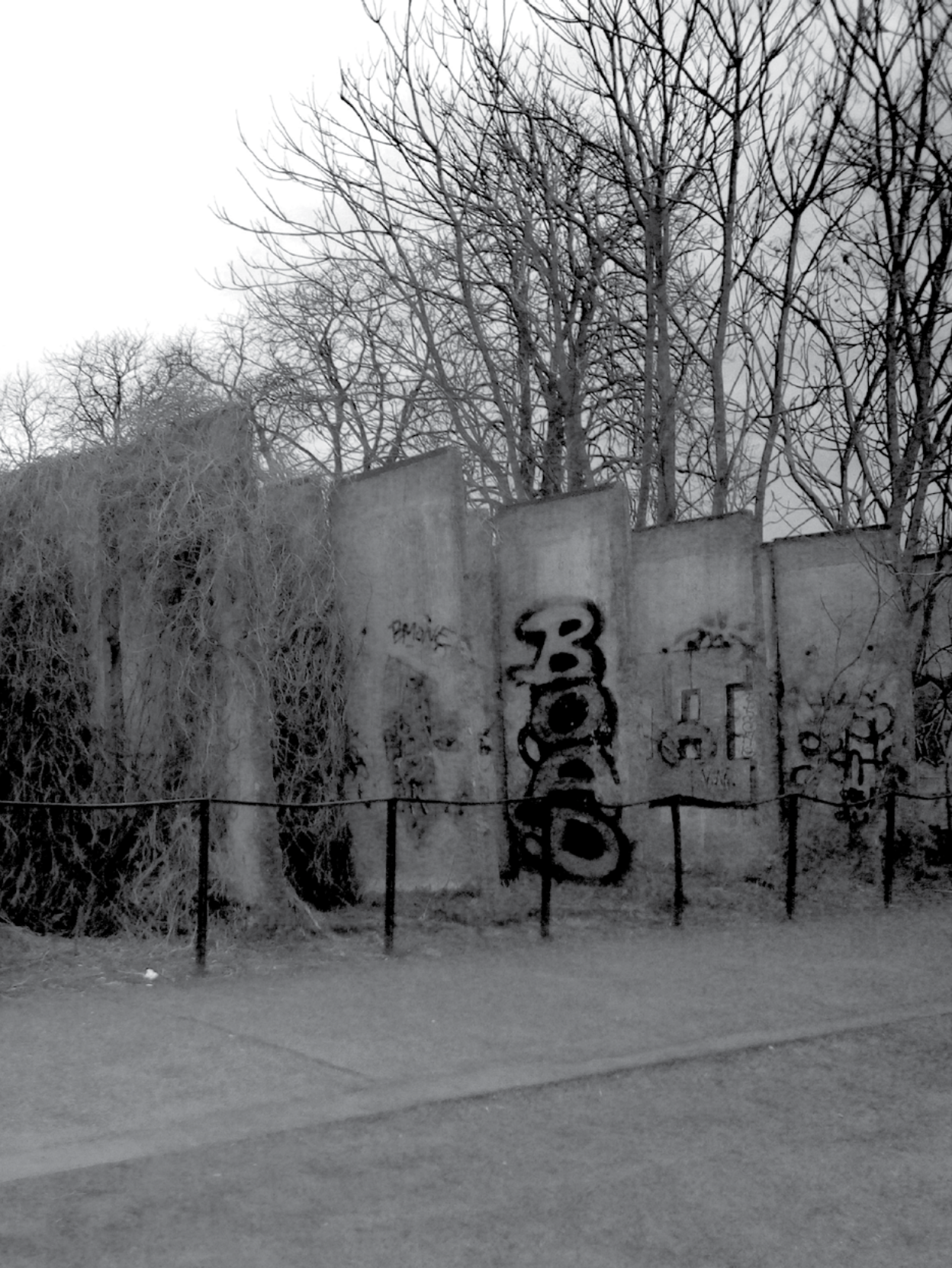
Τμήματα από το τείχος του Βερολίνου