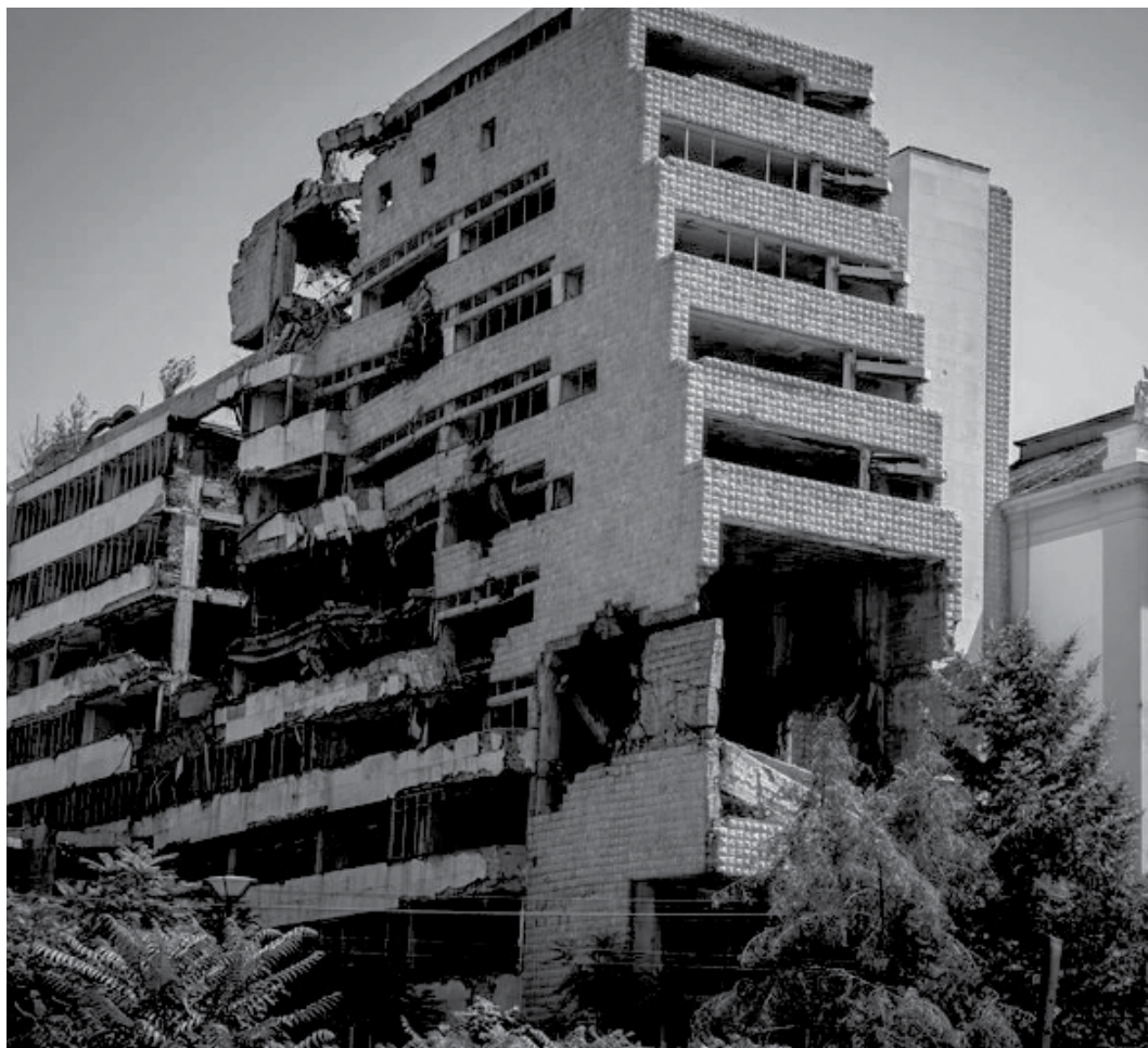
Βομβαρδισμένο κτίριο από τον πόλεμο του 1999 στο Βελιγράδι

μνήμης. Τα μνημεία αυτά λειτουργούν ως αρνητική μνήμη, ως μέσο απώθησης ενός ανεπιθύμητου παρελθόντος. Η αποδοχή των τραγικών γεγονότων καλλιεργεί και συγκροτεί εκ νέου την εθνική μνήμη μέσω της απόρριψης του προγενέστερου κακού συλλογικού εαυτού και μέσω της ενοχής για τα δεινά που προκλήθηκαν. Μέσα από την «εξιλέωση» για το παρελθόν επιδιώκεται η κρατική νομιμοποίηση στο σήμερα. Κάτι αντίστοιχο συμβαίνει και στην περίπτωση του τείχους του Βερολίνου, όπου ένα τμήμα του έχει διατηρηθεί και μετατραπεί σε μνημείο, στο οποίο εκτίθενται αφηγήσεις ατόμων που ζούσαν τόσο στη δυτική όσο και στην ανατολική Γερμανία. Έτσι το γερμανικό κράτος με έναν αντικειμενιστικό τρόπο παρουσιάζει διάφορες όψεις του πρόσφατου παρελθόντος, αφήνοντας (μέχρι ένα σημείο βέβαια) την επισκέπτρια να ανασυνθέσει μόνη της την ιστορική αφήγηση. Φυσικά θα μπορούσαν να γραφτούν πολλά πράγματα για την ανάλυση αυτών των δύο παραδειγμάτων, ωστόσο δεν εμπίπτουν στον σκοπό του κειμένου. Κυρίως εκτίθενται ώστε να αναδείξουν τις διαφορετικές όψεις της εθνικής και πολιτικής διαχείρισης της μνήμης.