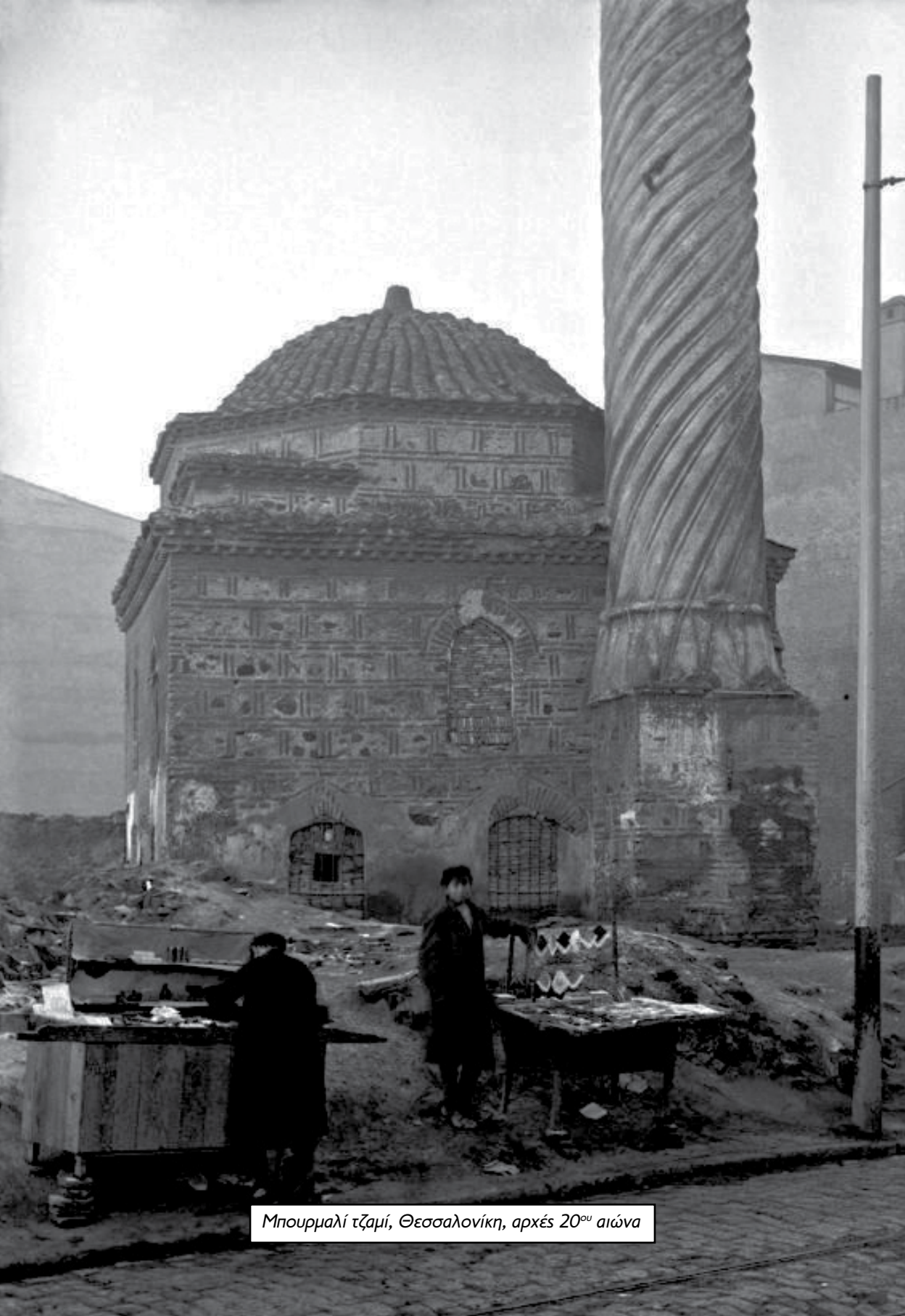
Μπουρμαλί τζαμί, Θεσσαλονίκη, αρχές 20 ου αιώνα